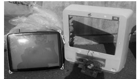
組合指定の不燃物ごみ袋に入れられていた小型テレビ

また、破壊したり自由解体されたものであっても「ごみ」としては扱えないので北部松山衛生センター組合で受入れ処分することはできませんのでご注意ください。