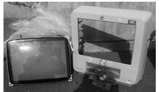
組合指定の不燃物ごみ袋に入れられていた小型テレビ

また、破壊したり自由解体されたものであっても「ごみ」としては扱えないので北部桧山衛生センター組合で受入れ処分することはできませんのでご注意ください。