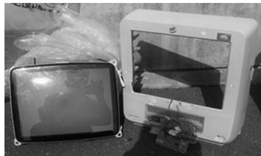
組合指定の不燃物ごみ袋に入れられていた小型テレビ

また、破壊したり自由解体されたものであっても「ごみ」としては扱えないので北部松山衛生センター組合で受入れ処分することはできませんのでご注意ください。